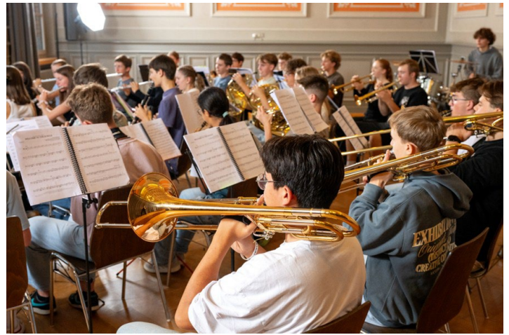
Einblick in die Musikalische Grundausbildung und die Formation Jugendmusik Winterthur United