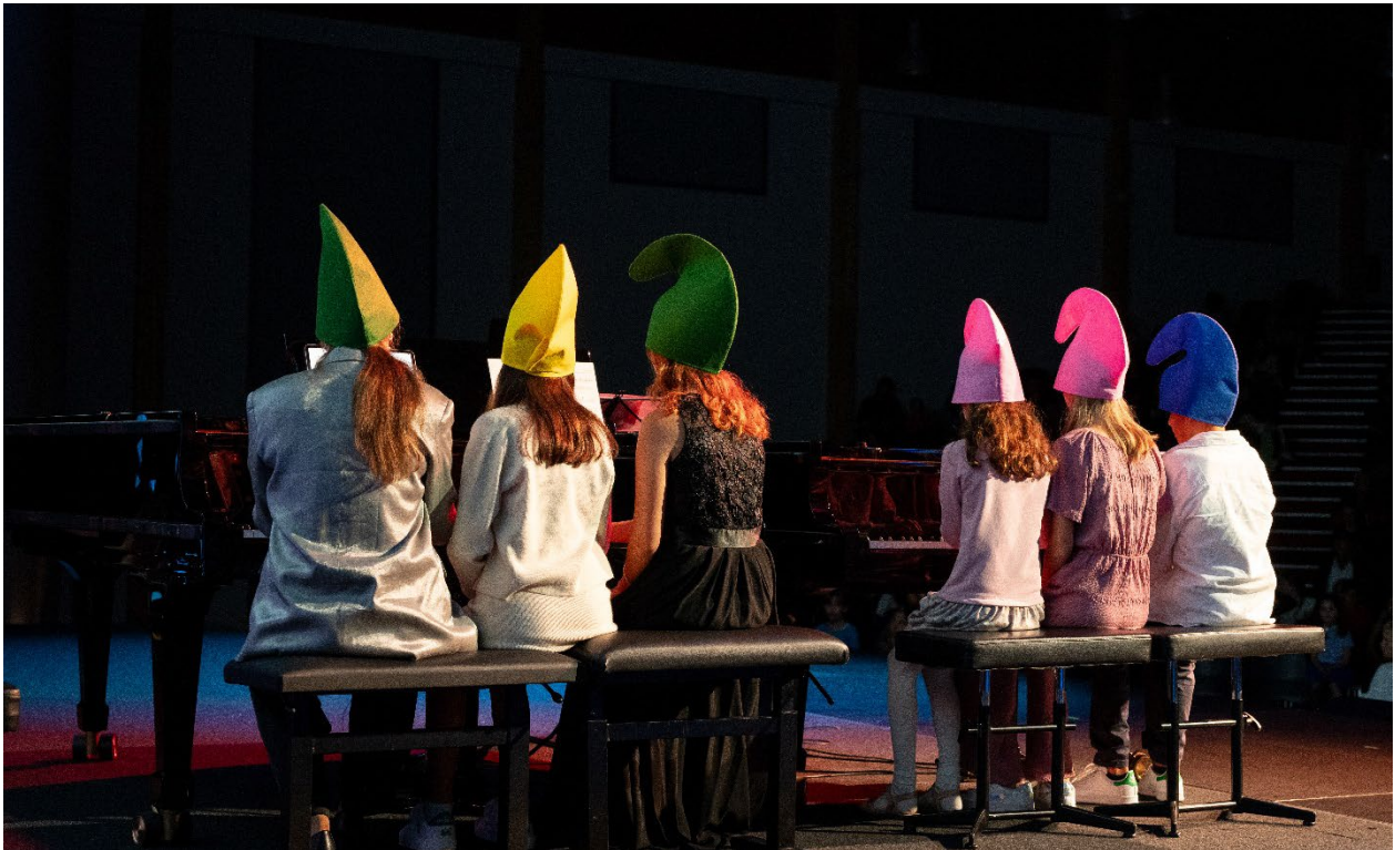
Bild: Tasten & Knöpfe Festival

der Jugendmusikschule Winterthur und Umgebung