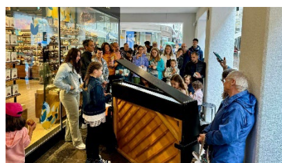
Tag der Musik