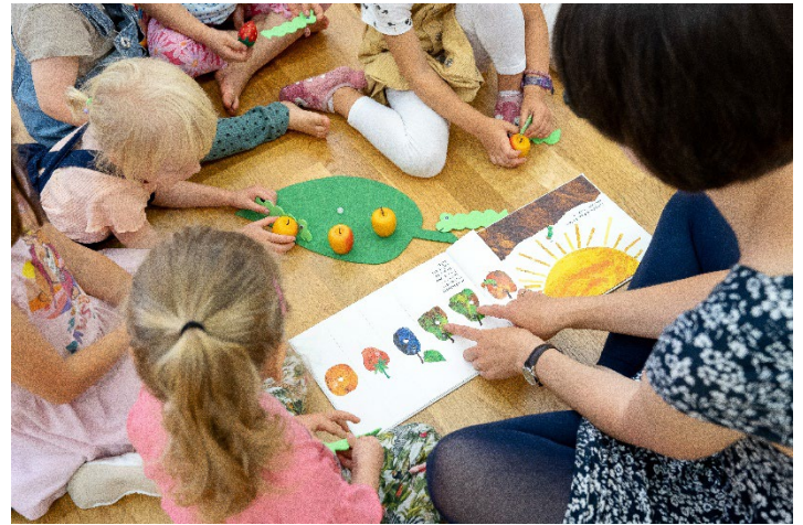
Einblicke ins Eltern-Kind-Singen und die Musikalische Grundausbildung